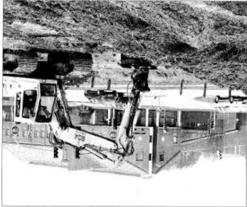
2500 Kubikmeter Boden müssen bewegt werden, damit ein Rewe-Markt auf die grüne Wiese am Dassendorfer-Kreuz ziehen kann.

Im Mai werden im Neubaugebiet "Hünenweg" in Kröppelshagen die ersten Häuser errichtet. Von Timo Jann